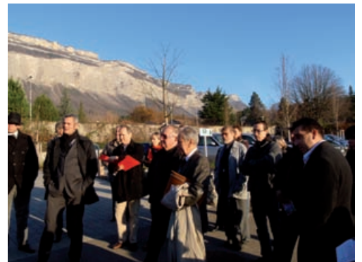
Le domaine de la Praly à Meylan