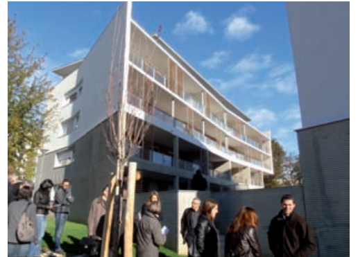
«Le Carmel» à La Tronche