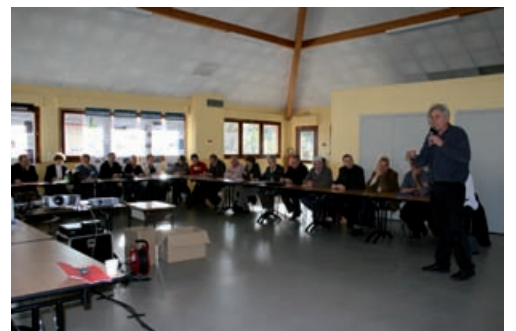
En réunion l'après-midi