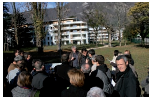
«Le Carmel» à La Tronche