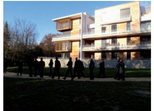
Le domaine de la Praly à Meylan

E n réunion l'après midi, nous avons d'abord échangé sur les objectifs et le fonctionnement de notre groupe de concertation. Nous commençons un travail à partir de certaines données qui sont désormais définies et qu'on ne peut plus remettre en cause : il s'agit par exemple de partir d'un « plan masse » qui définit des espaces particuliers pour la construction des bâtiments, qui protège d'autres parties en zones naturelles. Il s'agit aussi de réaliser un quartier de logements mixtes qui intègre des