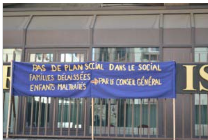
Mobilisation des travailleurs sociaux devant le conseil général le 12/4/13

de choses se font dans différents endroits, on ne les connaît pas toujours.» On revient sur la possibilité de «rendre visible» ce qui est caché: reportage photo ou vidéo, parcours de jeunes, pièce de théâtre...Beaucoup de formes sont possibles, et peuvent aider à changer les regards et faire bouger les lignes.