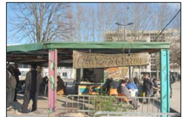
La Cabane à Gratter, Bordeaux - vidéo sur

Un local, un kiosque, un bus, un jardin, une cabane... Beaucoup de possibilités, mais peu de monde pour les creuser. Prochain RDV en mai pour le «Pique-nique des 100 lieux», date à confirmer.