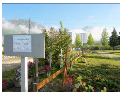
Le carré commun du Grand Sablon

de contact avec sa famille. Parmi les participants à la cérémonie, des membres du collectif "Mort De Rue" se sont rendus à l'enterrement.